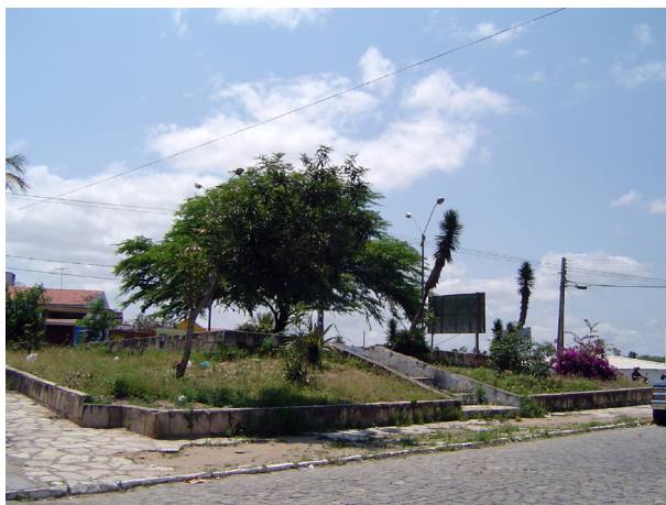
Imagem 01: Única praça do bairro.

Segundo o diretor da escola Manoel da Costa Cirne, referência no bairro, os moradores reconhecem a necessidade da cultura, do esporte e do lazer como forma de edificação social no sentido de educar e, sendo assim, buscam pela formação de eventos culturais, esportivos e espaços de lazer, e eles encontram, como fortes aliadas para construção de tais eventos, a escola que serve como fonte primária de educação e a SAB, como auxílio na união da comunidade.